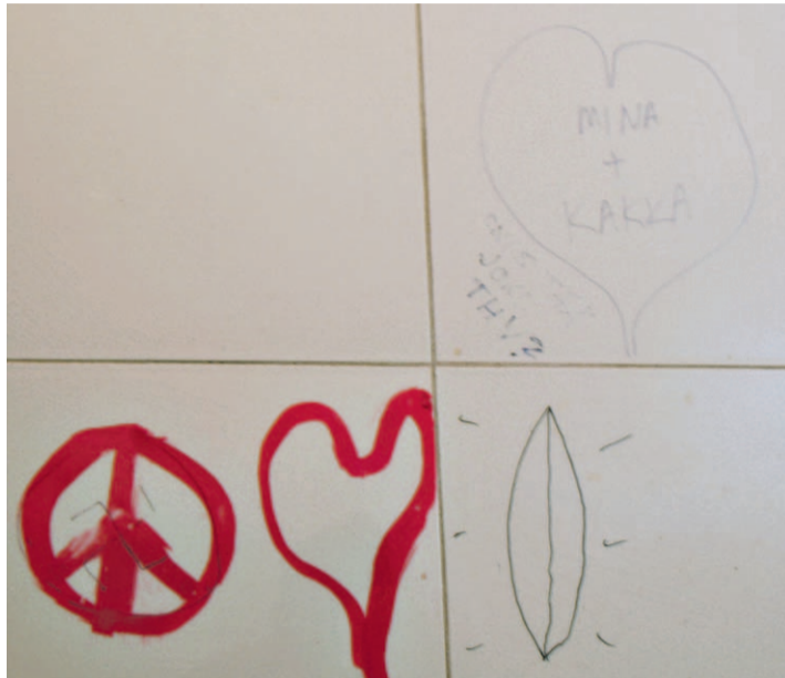
Semiotiikkaa Lozzin miesten vessassa.