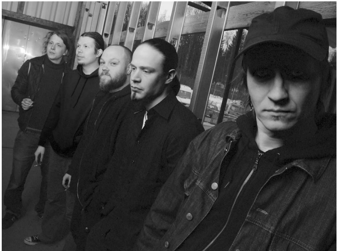
Purity jyrää vappuaaton Sima-bileissä Ilokivessä.