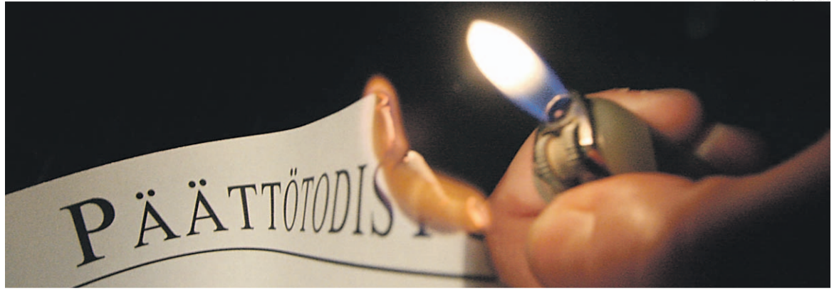
Lukion päättötodistuksen arvo ylioppilastutkintoon verrattuna on vähäinen.